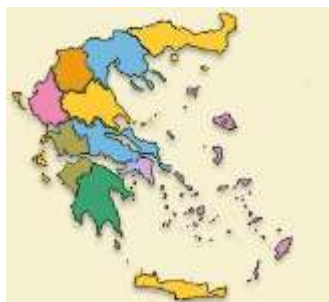
Εικόνα 3.1 Διοικητικές περιφέρειες της Ελλάδας όπου διεξήχθη η μελέτη (2012)